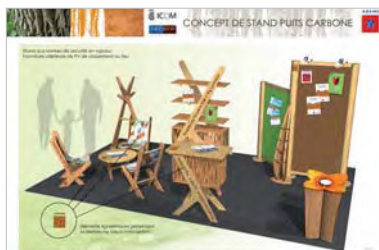
Stand ADEME Midi-Pyrénées éco-conçu