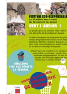
Festival Bandas y Peñas: rubrique éco-responsable du programme