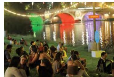
Festival Rio Loco : éclairage économe en énergie