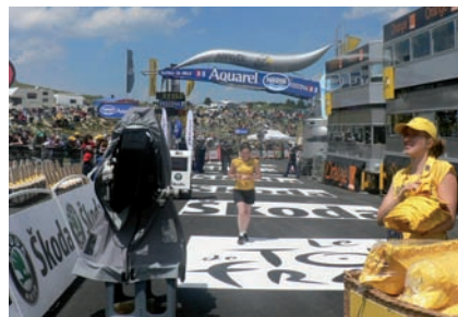
Tour de France