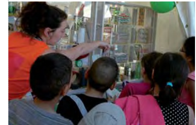
Festival Rio Loco : stand de sensibilisation