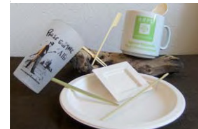
Vaisselle éco-conçue, vaisselle lavable et gobelet consigné