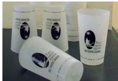
Folies du parc: gobelets réutilisables personnalisés