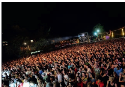
Festival Rio Loco

À titre d'exemples en 2008 en Midi-Pyrénées: le Festival Rio Loco a produit 6 fois moins de déchets que l'année précédente grâce à plusieurs actions (110 000 gobelets consignés et réutilisables, stand de sensibilisation, conteneurs facilitant le tri des déchets...). Les 5 toilettes sèches installées sur le Festival Pause Guitare ont permis d'économiser 12 000 litres d'eau. Sur le Festival Ecaussystème , un dispositif de 14 toilettes sèches a permis de récupérer 15 m 3 de copeaux souillés sur deux journées, lesquels ont ensuite été compostés pour faire de l'engrais. Enfin, 138 000 verres plastiques ont été économisés grâce à l'emploi de 85 000 gobelets réutilisables sur le Festival de Bandas y Peñas de Condom.