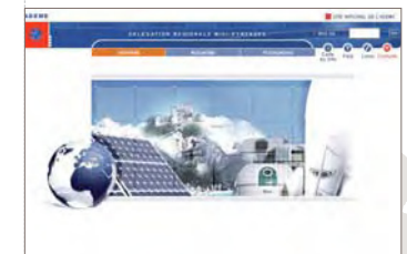
Page d'accueil www.ademe.fr/midi-pyrenees