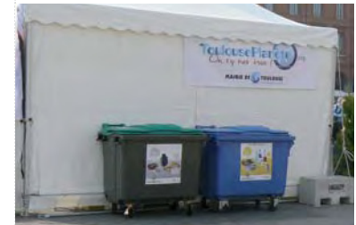
Toulouse-Planète: bacs de collecte sélective