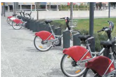
Toulouse : station Vélo Toulouse