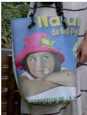
Sac fabriqué à partir de bâches signalétiques