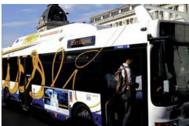
Toulouse : bus Tisséo (au GNV)