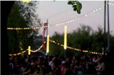
Rio Loco : éclairage basse consommation