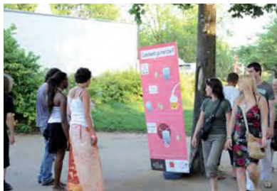
Festival Rio Loco: consignes gobelets réutilisables