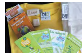
Exemples d'objets promotionnels

Les origines des objets promotionnels doivent être clairement identifiées (dans la mesure du possible). Certaines productions peuvent être localement réalisées pour de petites quantités.