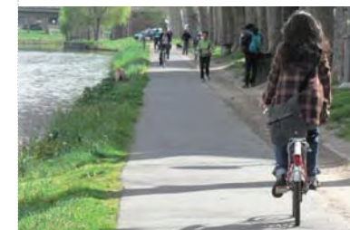
Canal du Midi: piste cyclable