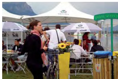
Tour de France Village Départ : point recyclage Vacances Propres