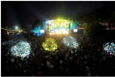
Festival Rio Loco