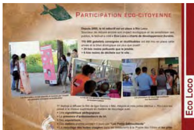
Rio Loco : bilan de la démarche éco-responsable