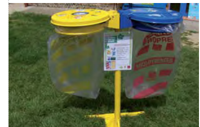
Balade Eco-citoyenne: double écollecto Vacances Propres