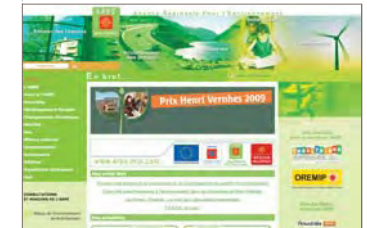
Page d'accueil www.arpe-mip.com