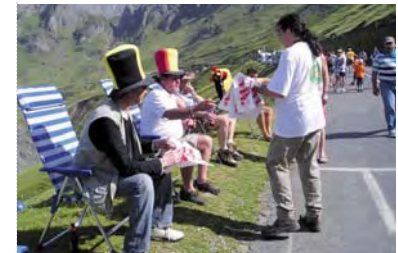
Tour de France en Midi-Pyrénées : distribution de sacs Vacances Propres au public