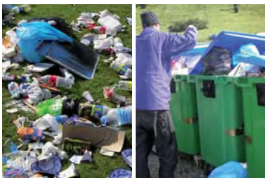
Tour de France (2001-2008) : baisse continue des impacts